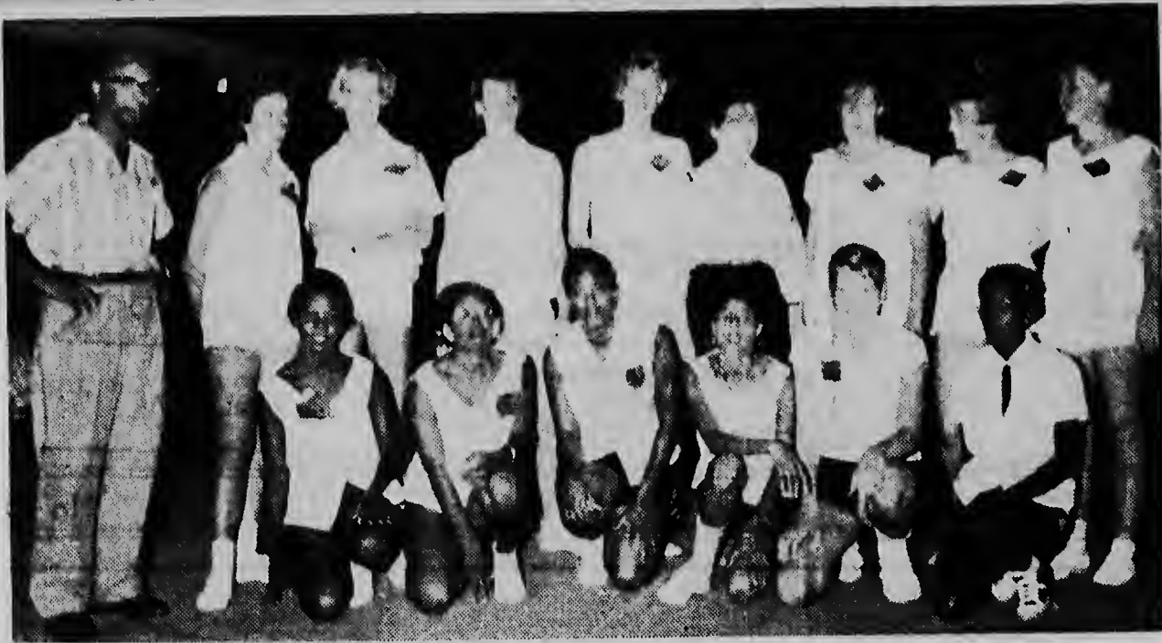
VOLLEYBALLERS DI P. STUYVESANT Y A. DE VEER